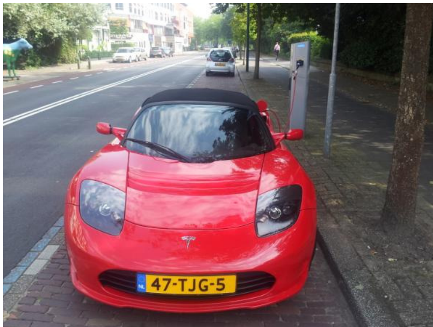
Elektrische auto aan de laadpaal in Oegstgeest